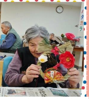
2020年も笑顔で過ごせますように!! しめ縄づくり