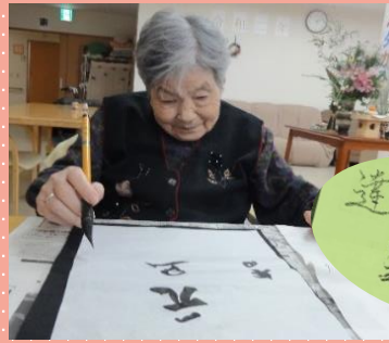
達筆じゃ~ 達筆じゃ~