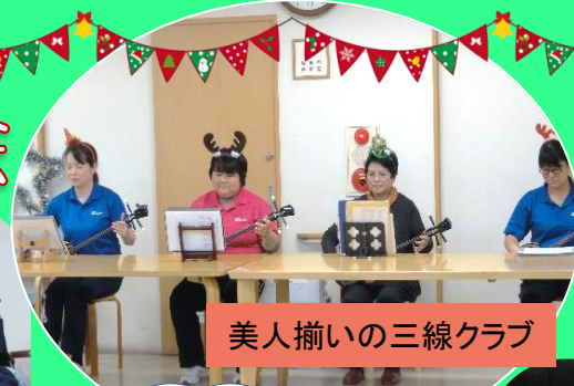
美人揃いの三線クラブ