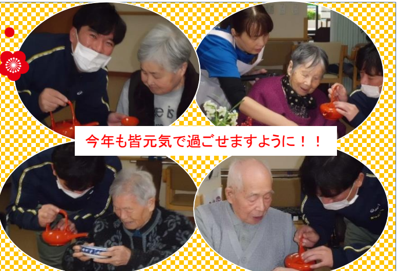
今年も皆元気で過ごせますように!!