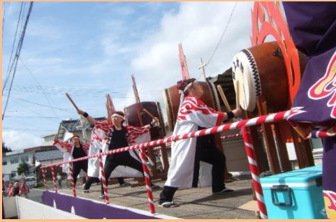
かっこいい炎上太鼓 みんなでハイポーズ!!