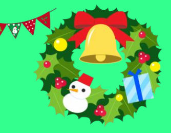
サンタさんからの甘~いプレゼントににっこり😊