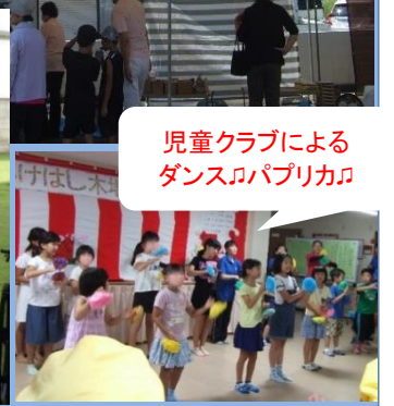
児童クラブによる ダンス♪パブリカロ