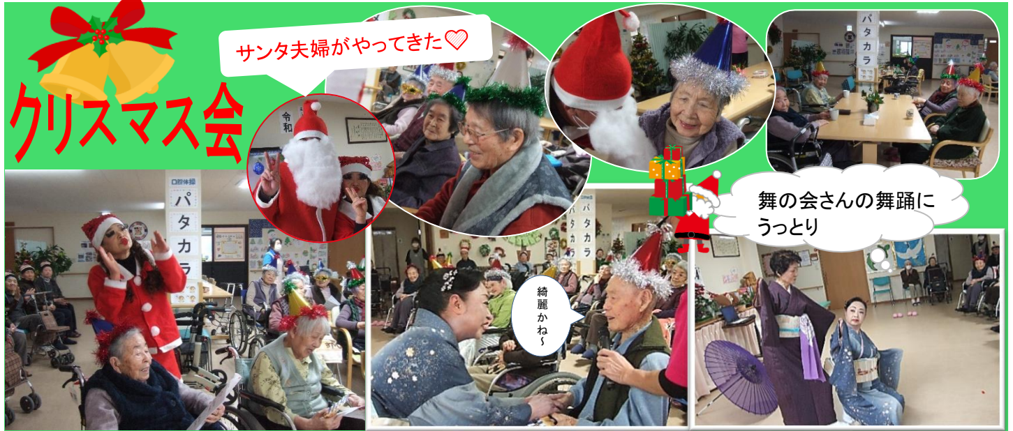
舞の会さんの舞踊に うっとり