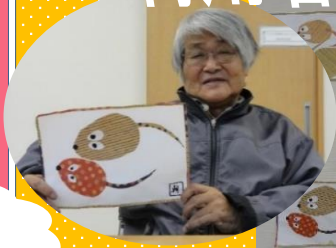
今年の干支(ねずみ)完成で一す!